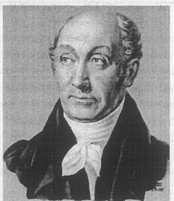
1. 2. 3.

1. К.П. Победоносцев (1827-1906) активный консервативный деятель, юрист, переводчик, публицист, член Академии наук, обер-прокурор Святейшего Синода, — правозащитная деятельность, разработка документов судебной реформы 1864 г. В начале 60х гг XIX в. отстаивал следующие принципы реформирования судопроизводства: независимость, беспристрастность, отделение суда от администрации; касалась на формирование суда присяжных. Однако в последствии стал придерживаясь более консервативных идей. Написал труд «Курс гражданского права и следил его одним из главных трудов своей жизни». Критиковал карательные и парламентаризм.