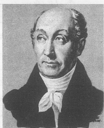
1. 2. 3.